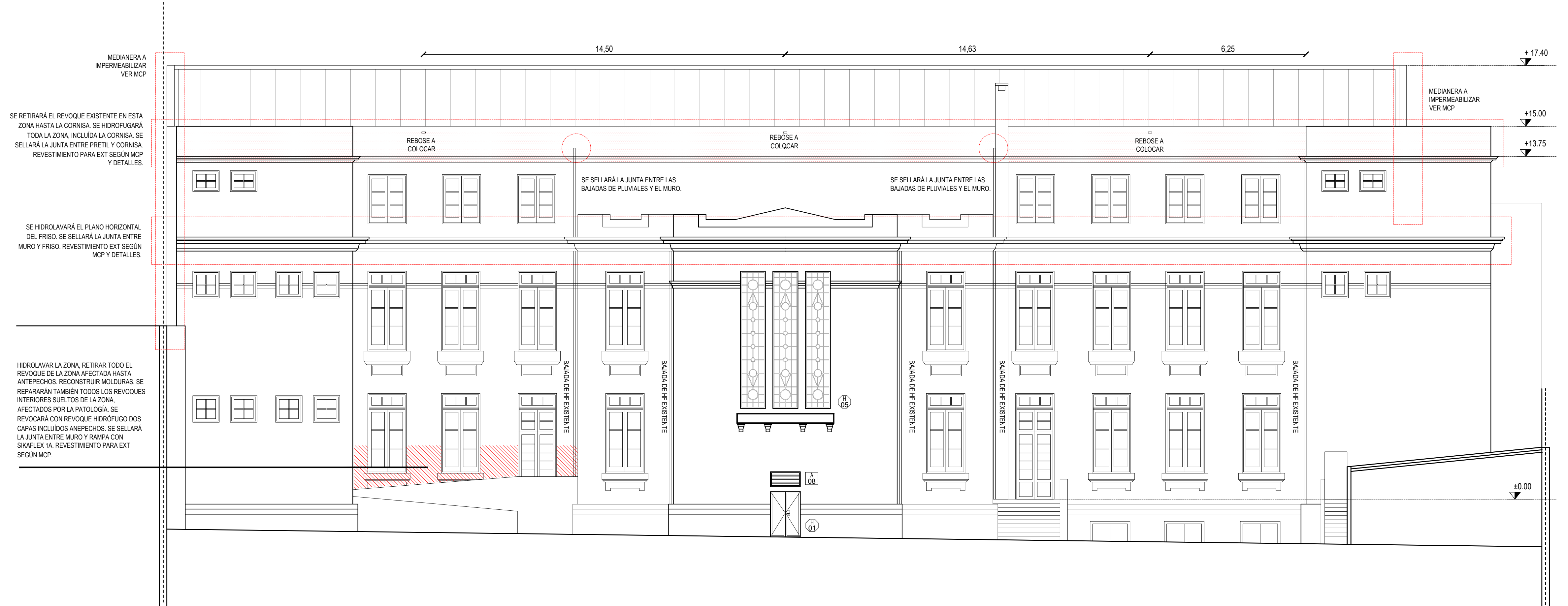
FACHADA NORTE ESC. 1.100